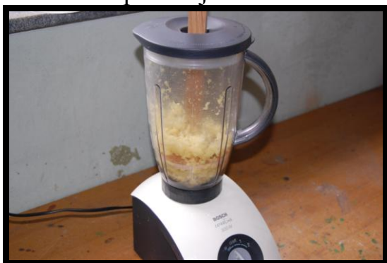
7. ...in vklopil sekljalnik.