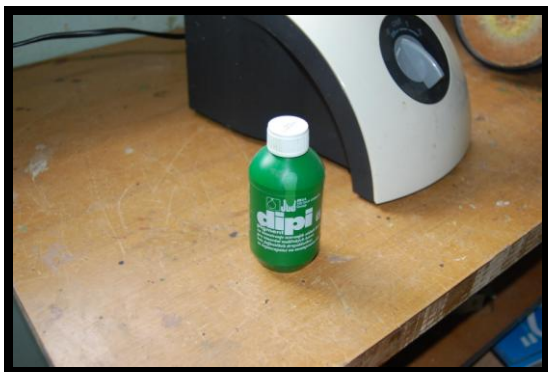
9. ...sem vzela zelen pigment...