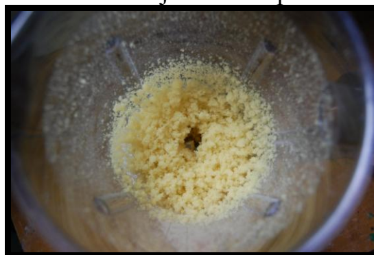
8. Ko sem sekljalnik izklopil...