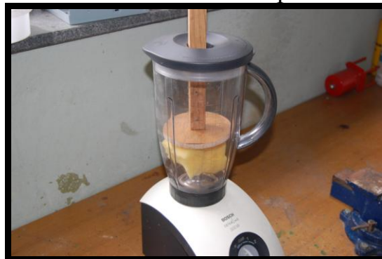
6. ...vstavil stiskalnico in pokrov...